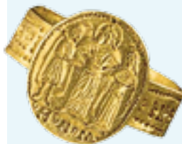
Найденное в районе Канопуса золотое обручальное кольцо с изречением Иоанна Златоуста на греческом языке датируется VII веком. В то время Египет был частью Византийской империи