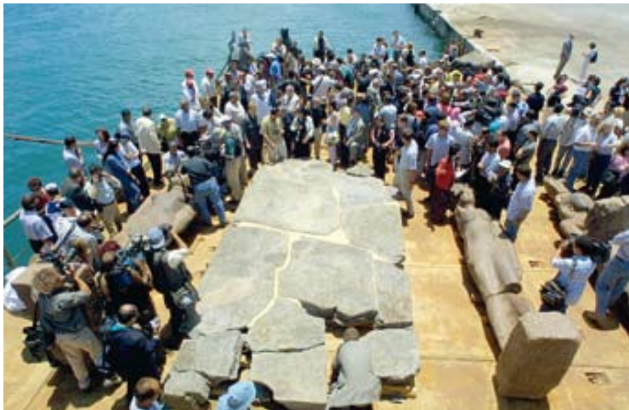
Шестиметровая стела с греческими и иероглифическими надписями, датируемая эпохой Птолемея VII (II век до н. э.), была обнаружена в храмовом районе Гераклиона и поднята со дна моря в 2001 году. Сейчас это самый крупный экспонат выставки, вес стелы – более 15 тонн

графируем район поиска. А если догадки подтверждаются, начинается собственно археологическая работа: мы составляем карты расположения объектов, потом проводим фото- и видеосъемку. Затем специалисты приступают к консервации, восстановлению и каталогизации находок. Анализом древностей занимаются эксперты, которые потом участвуют в подготовке отчетов.