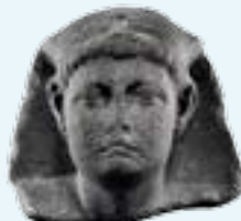
Гранитная голова, найденная в затопленных кварталах Александрии, принадлежит статуе последнего фараона Египта Птолемея XV, сына Клеопатры VII и Юлия Цезаря

На дне Средиземного моря покоятся руины трех крупных городов Древнего Египта