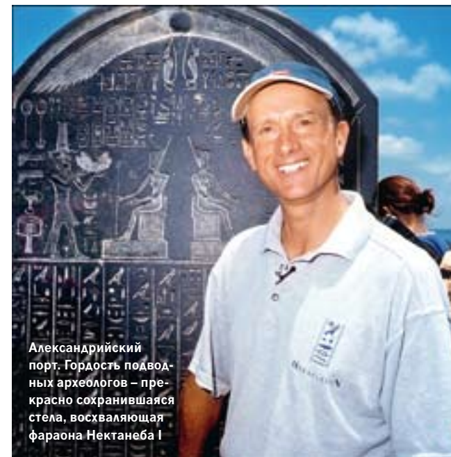
Александрийский порт. Гордость подводных археологов — прекрасно сохранившаяся стела, восхваляющая фараона Нектанеба I