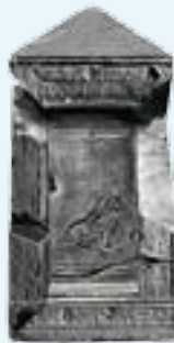
Астрологический календарь Наос Десятилетия времен фараона Нектанеба I извлекли из-под руин Гераклиона