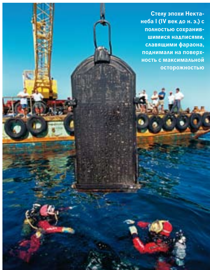
Стелу эпохи Нектанеба I (IV век до н. э.) с полностью сохранившимися надписями, славящими фараона, поднимали на поверхность с максимальной осторожностью

Одиссея началась 13 лет назад, когда исследовательская шхуна «Принцесса Дуда» бросила якорь в заливе Абу-Кир. Заручившись поддержкой египетского Верховного совета по древностям, Годдио возглавил поиски царских